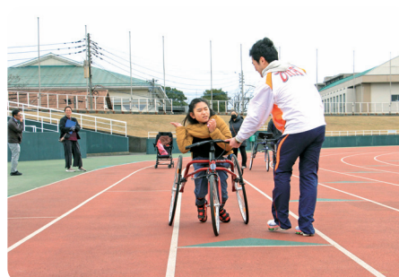
フレームランナー