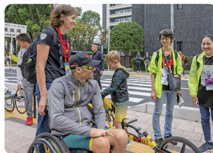
ウォームアップ前