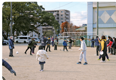
フライングディスク