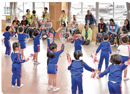
外国人選手交流会(千代町幼稚園・大道小学校)