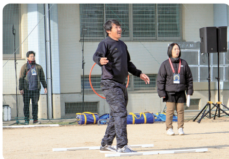
フライングディスク 始投式