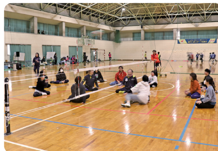
シッティングバレー