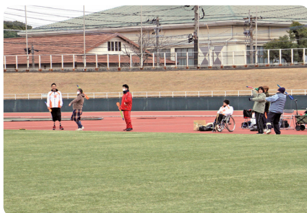
ジャベリックスロー