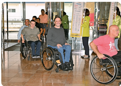
外国人選手第一陣到着