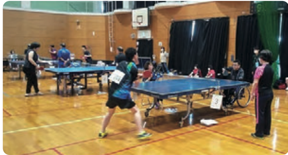
各コートで激しい試合が展開！