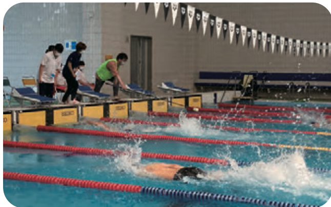
視覚障がい者へ合図！息ピッタリ！