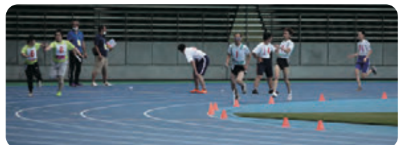
大分県障がい者スポーツ大会 最後の競技 リレー