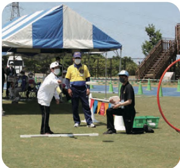
アキュラシー (ディスリート5)