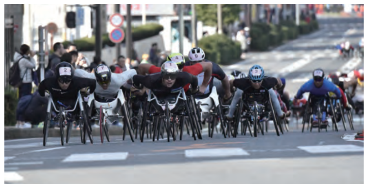
第40回記念大分国際車いすマラソン 2021.11.21 (大分市舞鶴橋付近)