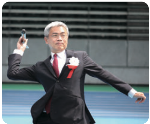
黒田副知事によるオープニングセレモニー