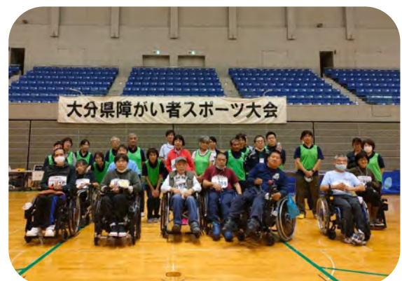
健闘を讃えあい記念撮影