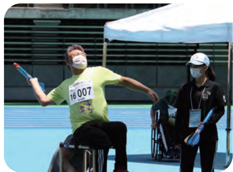
ジャベリックスロー