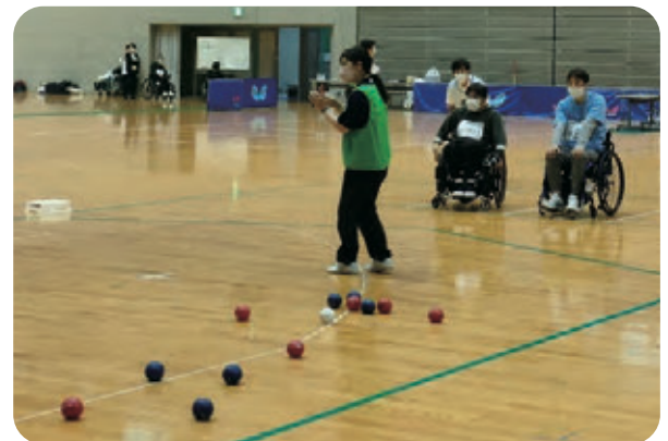
試合終了! 勝者はどっちだ!