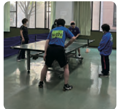
サウンドテーブルテニスの熱戦！