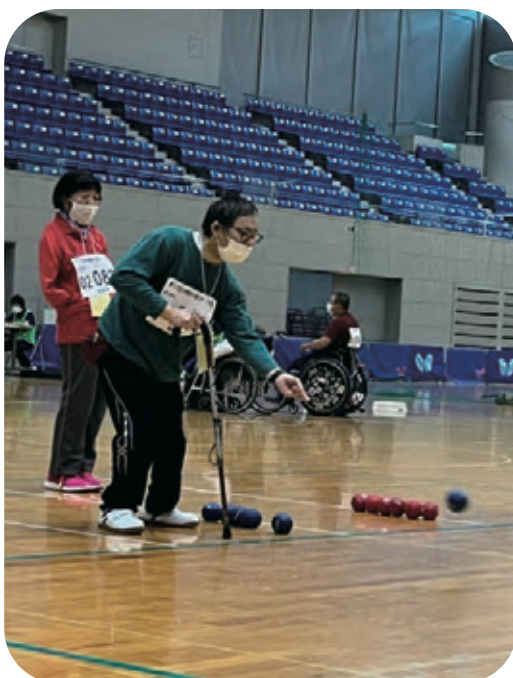
狙いを定めて! 渾身の第1投!