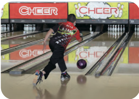
目指せ! パーフェクト!