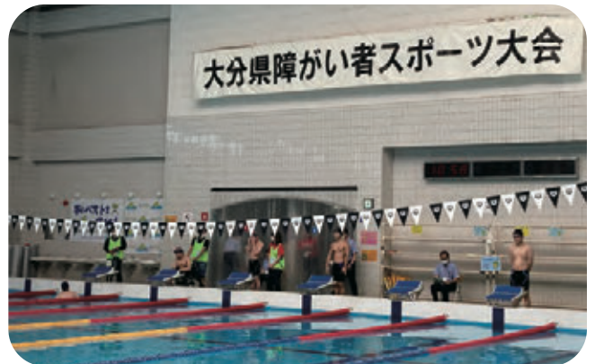
スタート前の緊張感！