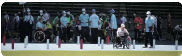
倒さないように慎重に早く！ スラローム